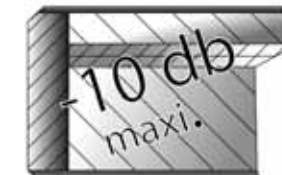
Chants alaise bois (CD)

Epoxy / Chrome: Utiliser de l'eau savonneuse. Mélaminé / Stratifié / Compact : Utiliser de l'eau chaude et de la lessive non abrasive. Plastique (polyéthylène / polypropylènes): Utiliser de l'eau savonneuse et un chiffon doux non pelucheux. Ne pas utiliser: Solvant cétonique; Pâtes et crèmes abrasives; Détergents (ne pas gratter).