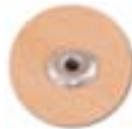
Fixation par rivets