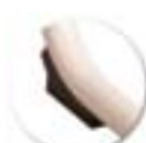
Embout anti-basculé, bords arrondis, non tachant, non marquant, fixé par 2 rivets. Pérennité garantie.