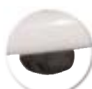
Butée appui sur table