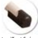
Embout coiffant fixé par rivets. Pas de risque d'infiltration de l'eau lors du nettoyage. Peinture du piètement protégé du frottement des chaussures.