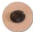
Fixation Vis TRCC et écrou.