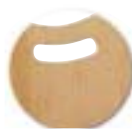
Prise de main; manipulation facilitée

Ne pas utiliser: Solvant cétonique; Pâtes et crèmes abrasives; Détergents (ne pas gratter).