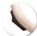
Embout anti-bascule, bords arrondis, non tachant, non marquant, fixé par 2 rivets. Pérennité garantie.