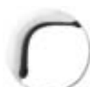
Butée appui sur table + protection angle du plateau de table