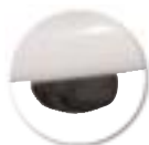
Butée appui sur table