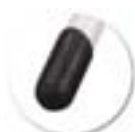
Embouts coiffants non tachants et non marquants (polyéthylène).