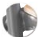
Soudure haute résistance avec apport de métal