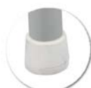
Embouts non tachants et non marquants (polyéthylène).